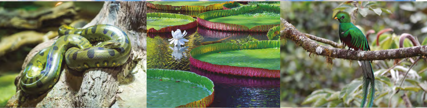
En ambas pág: el barco de expedición Aqua Nera. Arriba de izq. a der: anaconda verde; lirio de agua; quetzal crestado

Hacer una expedición naviera en el mayor espacio verde del planeta era, para mí, una fantasía viajera que llevaba años construyendo. El río Amazonas, nombrado una de las siete maravillas naturales del mundo el 11 de noviembre del 2011 por la fundación New 7 Wonders, tiene su lugar de nacimiento en Perú y se despliega a través de nueve países de América del sur.